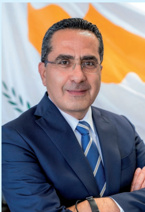
ANDREAS HADJICHRYSANTHOU, Botschafter der Republik Zypern in Deutschland

Zypern geht gleichwohl bedachtsam vor. So hat die Regierung 2017 eine umfassende Strategie verabschiedet, die auf einen nachhaltigen Tourismus setzt. Wichtigste Zielsetzung: den Tourismus weiter zu diversifizieren und außerhalb der Sommersaison Urlauber anzuziehen. Ob Kultur- und Städtereise in Limassol, Wandern im Troodos-Gebirge oder die Sandstrände in Ayia Napa – auf diese Weise werden alle Bezirke noch stärker an der positiven Entwicklung partizipieren. ▶